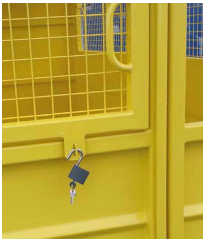
Vhazovacie dvierka so zámkom v hornej polovici vrát