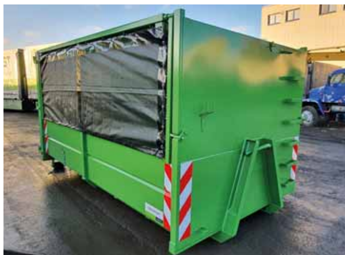
Kontajner s rolovacou plachtou